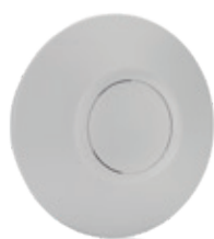
Le plus puissant S-Pure SCVU2