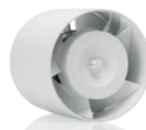
Le moins visible S-Pure EMR/EMRSR