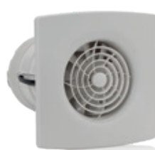
Applicable partout S-Pure SR