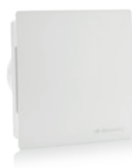
Le modèle d'entrée S-Pure Ace