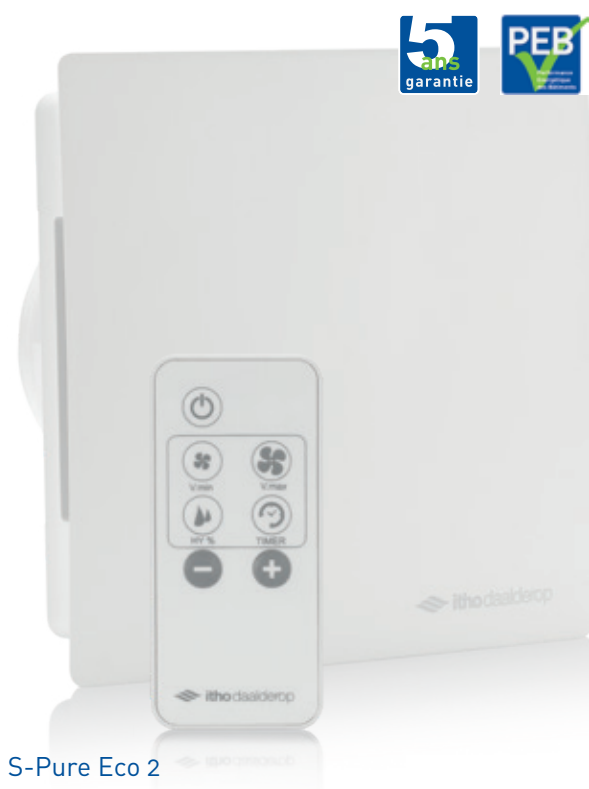
S-Pure Eco 2