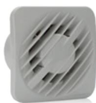
En toute simplicité S-Pure AXN