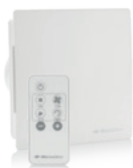
Le top S-Pure Eco2