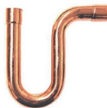
Figuur 1 oliebocht

Om de compressor te beschermen dient er bij een groter hoogteverschil dan 5 meter gebruik te worden gemaakt van een zogeheten oliebocht, zie figuur 1. De eerste dient na 5 meter vanaf het buitendeel te worden geplaatst en daarna om de 5 meter.