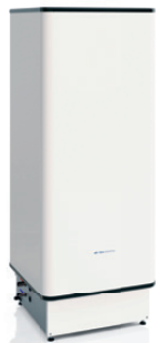
I-WPV 200L 3G