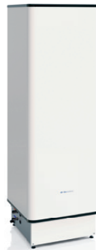
I-WPV 240L 3G