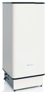
I-WPV 150L 3G