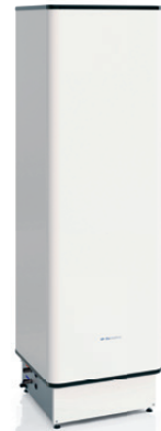
I-WPV 270L 3G